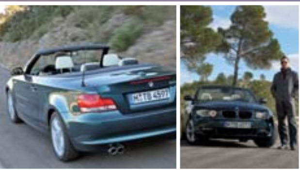
Markus Bistrick auf Erprobungsfahrt.