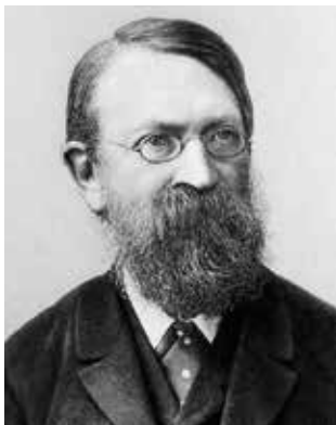
Professor Ernst Mach, der 1838 geboren wurde, kann zu Recht als „Multitalent“ bezeichnet werden. Durch seine Kritik an Newton und der rein mechanistischen Sicht auf die Physik gilt Mach als einer der Vordenker der Einsteinschen Relativitätstheorie.