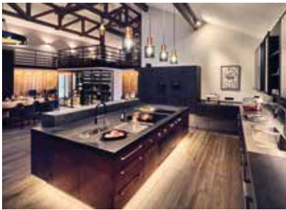
Das Stammhaus von Westerberger Fullblood: Treffpunkt von Sterneköchen und kulinarischen Vordenkern.

Was sich hier technisch und steril liest, vollendet sich zu einem Bild, wenn man die gewundene Straße hinauf zum Gut Westerberg fährt – ein paar Kilometer hinter Grafing, in fast unberührter Natur, wo die Kuh-Welt noch in Ordnung ist. Hier hat es die entsprechende Fläche, aus dem der Traum vom Tierwohl gemacht ist. „Wir wollten zeigen, dass es anders geht“, erklärt der 58-Jährige seine Motivation. „Nicht das Tier soll sich dem Menschen anpassen, sondern umgekehrt.“ Mittlerweile gibt es auf dem Gut nicht nur Stallungen und einen kleinen Hofladen, sondern auch eine beeindruckende Showküche mit Reife- und Weinschränken, die – mit dem entsprechenden Geldbeutel – samt Sternekoch und Weinbegleitung gemietet werden kann.