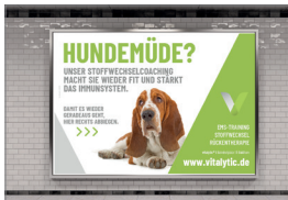
Vistenkarten, Aufkleber, Banner, Roll-ups u.v.m.