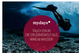
Reisekatalog für domicillio.com, redaktionelle Texte u.a. für mydays