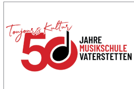
Logo-Entwicklung u.a. für Kundler Allianz Generalvertretung oder Musikschule Vaterstetten