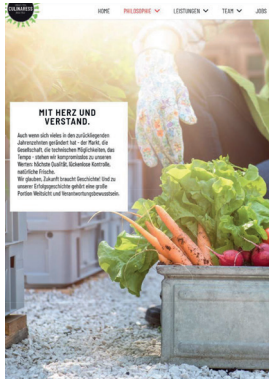
Websites inkl. Konzept und Programmierung – u.a. Culinaress, Hanrikbau und Musikschule