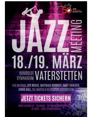
Plakate und Flyer für u.a. die Musikschule Vaterstetten