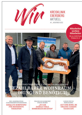
Regelmäßige Mitarbeiterbroschüre für die Kreisklinik Ebersberg