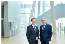
(Image)-Filme, Fotografie und Text (u.a. IFAO Imagebroschüre)