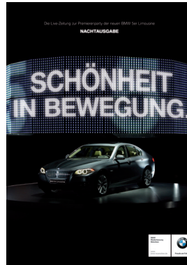
Event-Zeitung zum Marktstart des 5er BMW. Komplette Produktion während der Veranstaltung!