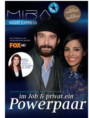
Event-Zeitung u.a. auch zur SKY MIRA Award Verleihung in Berlin