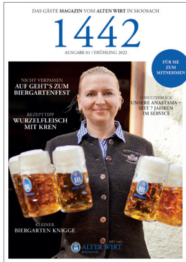
Regelmäßiges Gästemagazin u.a. für den Alten Wirt in Moosach (inkl. Redaktion und Fotos)